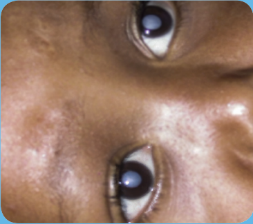
© RICHARD BOWMAN CC BY-NC-SA 4.0